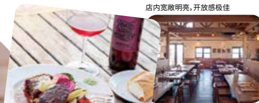
店内宽敞明亮，开放感极佳