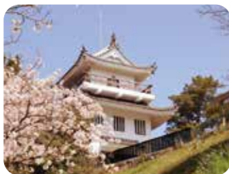
MAP A C-1

☎0569-34-8888 (常滑市观光广场) 地址:常滑市金山宇城山内 营业时间:观景台/9点~17点※11月~2月截止至16点 交通:从免费社区巴士Grüün“城山公会堂”站下车步行7分钟 停车场:100个车位