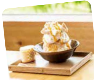
夏季推出烤蛋白奶油霜分量十足的刨冰(1,680日元)。令人惊喜的新口感！