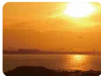
MAP A E-7

☎0569-34-8888 (常滑市观光广场) 地址:常滑市大谷高砂 交通:从免费社区巴士Grüün“北大谷”站下车步行10分钟 停车场:20个车位