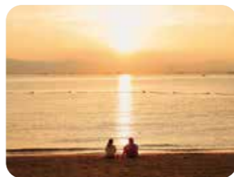
MAP A B-1

☎0569-34-8888 (常滑市观光广场) 地址:常滑市大野海岸 交通:从名铁“大野町”站下车步行7分钟 停车场:50个车位(收费)