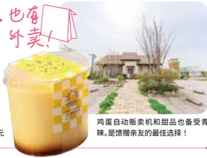
鸡蛋自动贩卖机和甜品也备受青睐。是馈赠亲友的最佳选择！