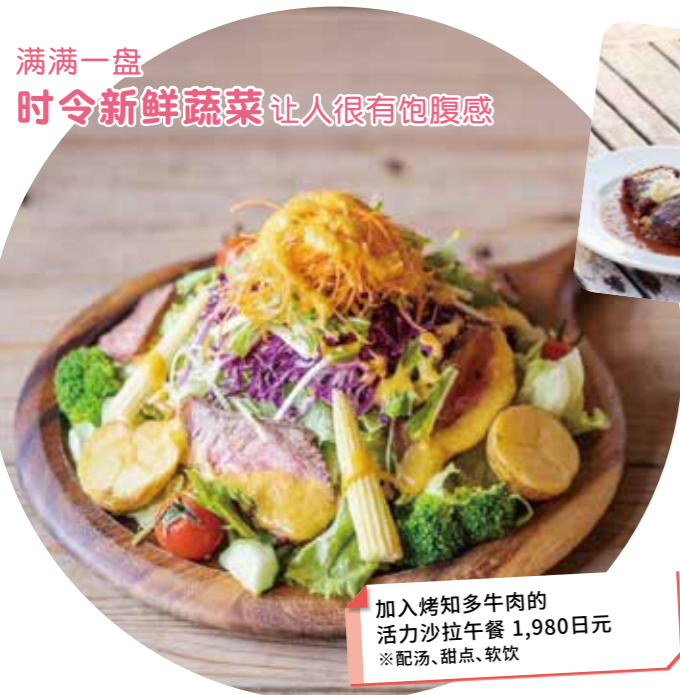
加入烤知多牛肉的活力沙拉午餐 1,980日元 ※配汤、甜点、软饮