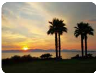
MAP A D-9

☎0569-34-8888 (常滑市观光广场) 地址:常滑市坂井海岸 交通:从免费社区巴士Grüün“坂井中央广场”站下车步行14分钟 停车场:平时约30个车位,仅在海水浴场开放期间约50个车位(5月~8月仅周六和周日收费/每个车位1,000日元/天)