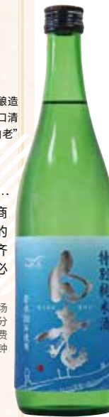
MAP A D-6

☎0569-35-4003 地址:常滑市市场町4-10 营业时间:10点~16点30分 休息日:周日和节假日 交通:从免费社区巴士Grüün“古场”站下车步行2分钟 停车场:约10个车位