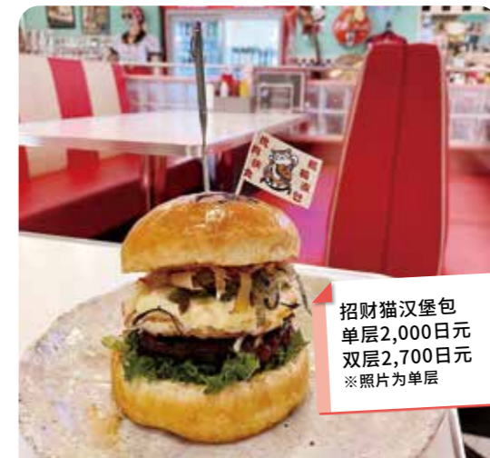
招财猫汉堡包 单层2,000日元 双层2,700日元 ※照片为单层